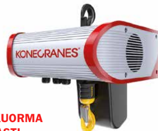
NIMELLISKUORMA 5 000 KG ASTI