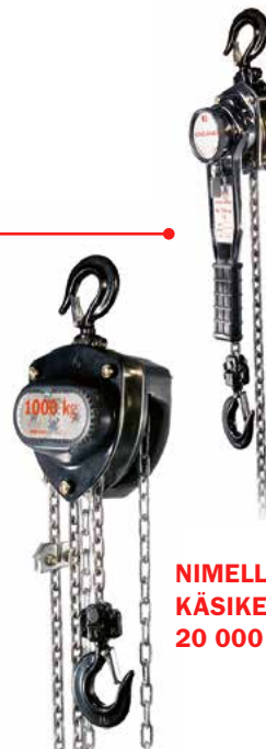
NIMELLISKUORMA VIPUTALJOILLA 3 000 KG ASTI