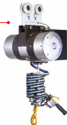
NIMELLISKUORMA 350 KG ASTI